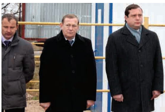
Глава Зайцевского сельского поселения Н.И.Киселев, Глава районной Администрации Ю.В.Панков, Губернатор Смоленской области А.В.Островский

Первым в деревне к природному газу был подключен дом № 8 по