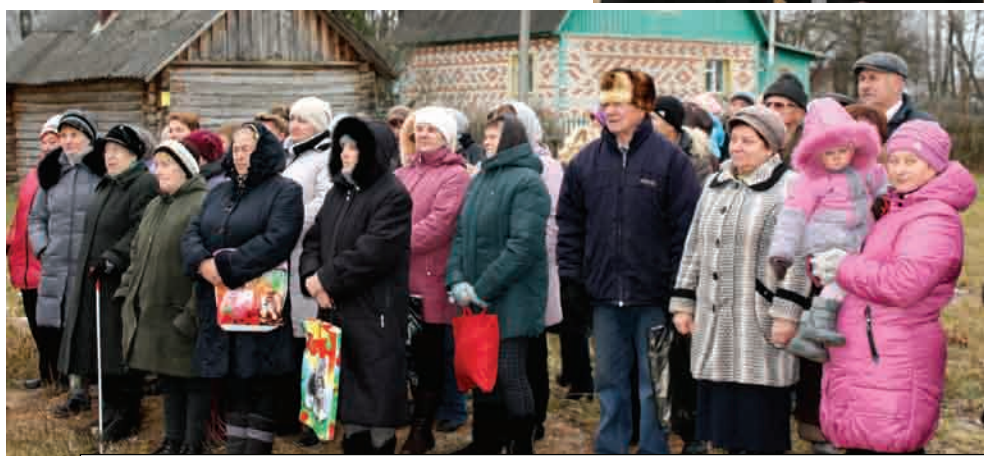
Жители деревни Зайцево собрались на торжественную церемонию пуска газа